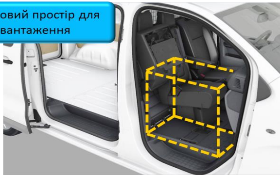
Додатковий простір для завантаження