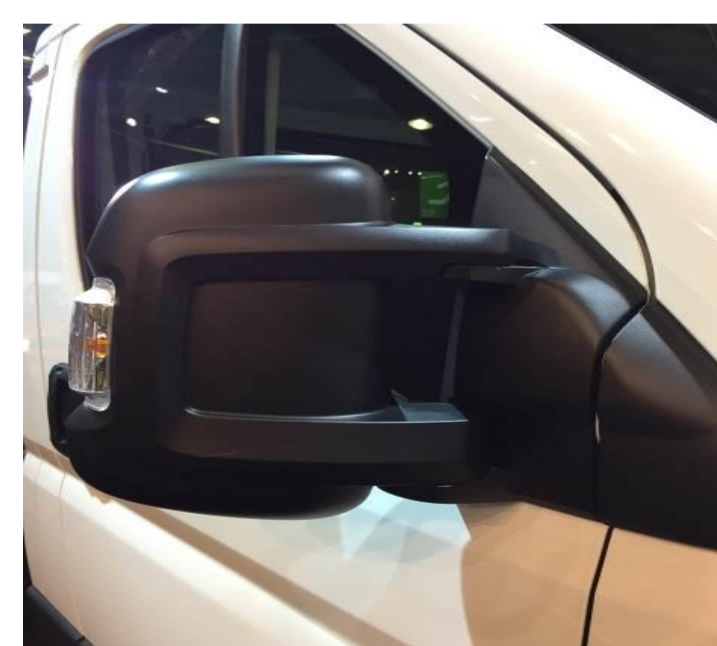
↑ стандартні зовнішні дзеркала.